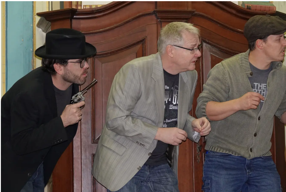
Hält sich für genialer, als sie ist: die Gaunerbande in «Lady Killers».

Klarer Fall: Auf der zu einer Mansarde umgebauten Bühne wird es mordsturbulent. Leichen kommen zum Glück keine vor oder sie verschwinden einfach unbemerkt. Trotzdem entwickelt sich reichlich kriminelle Energie, ausgehend von einem diebischen Quartett, das einen Geldraub plant und sich für genialer hält, als es tatsächlich ist.